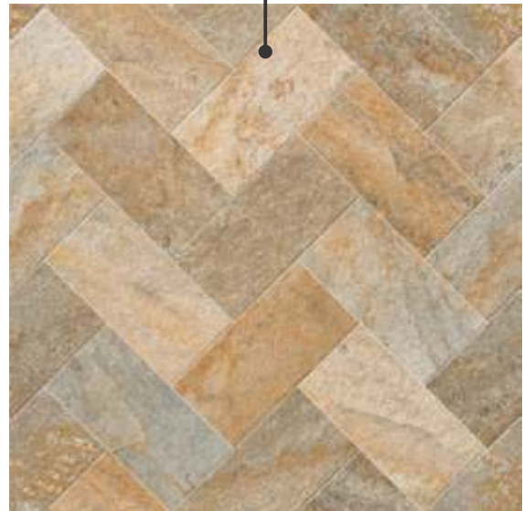
PHD71490R / Pavia 6 faces | V3