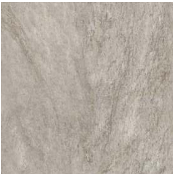
PHD71500R / Trentino 6 faces | V3