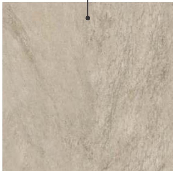
PHD71510R / Cosenzo 6 faces | V4