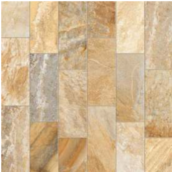
PHD71480R / Turim 5 faces | V3