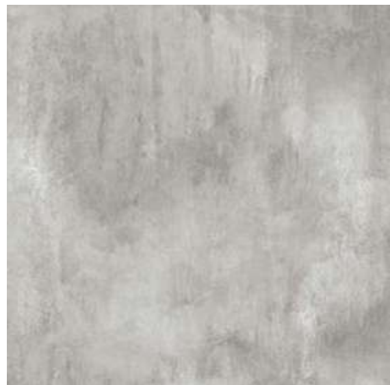
PHD71470R / Matera 6 faces | V4