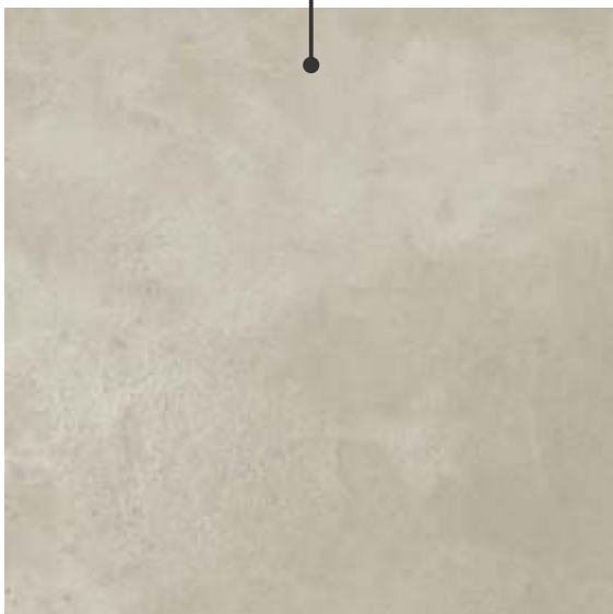
PHD71460R / Varese 6 faces | V4